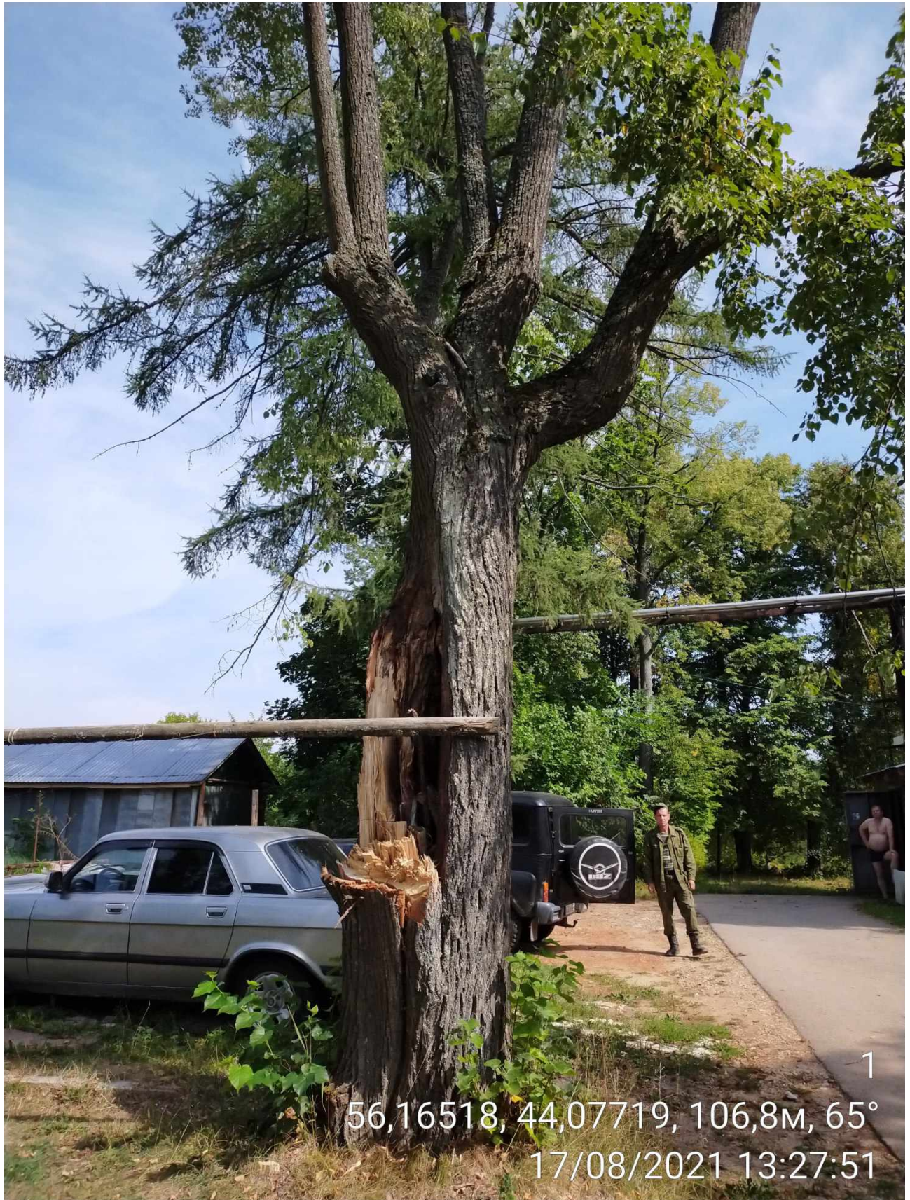
Дерево № 1